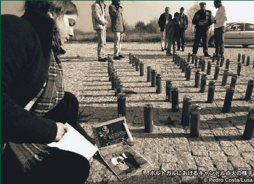
ポルトガルにおけるキャンドル点火の様子

WORLD DAY OF REMEMBRANCE FOR ROAD TRAFFIC VICTIMS